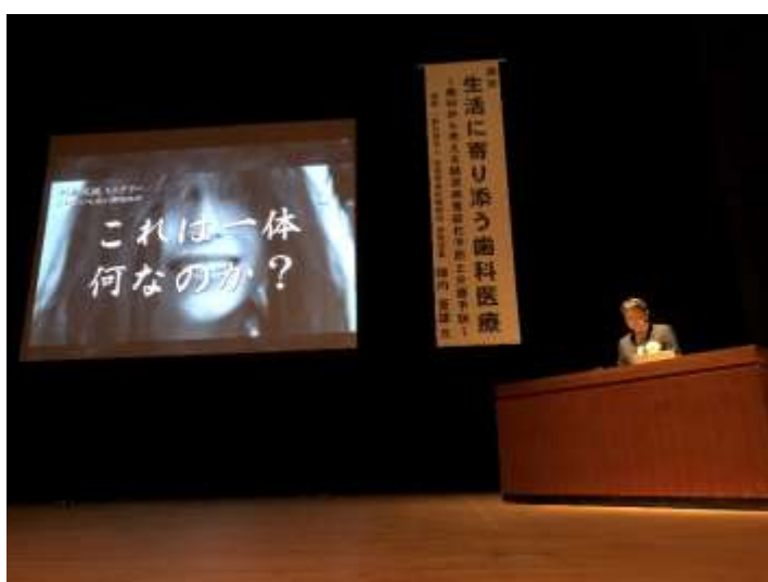
2月19日開催の講演会の様子 スライドの内容が気になる人は「佐賀県歯科医師会」のホームページをチェック！