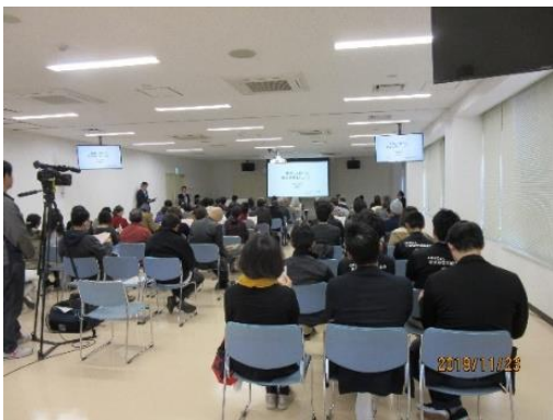
講演会の様子 満員！