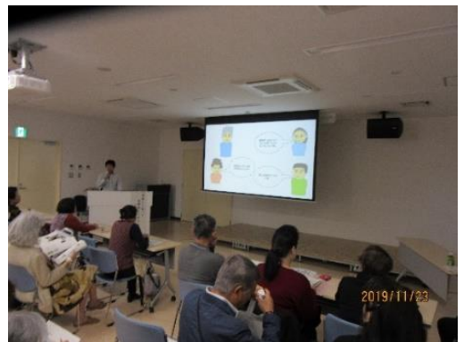
イラストを使った分かりやすい山崎先生の講演の様子