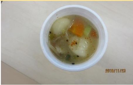
臭だくさんの「だご汁」