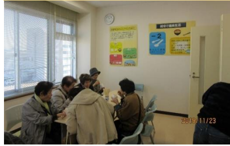
糖尿病予防のポイントを掲示